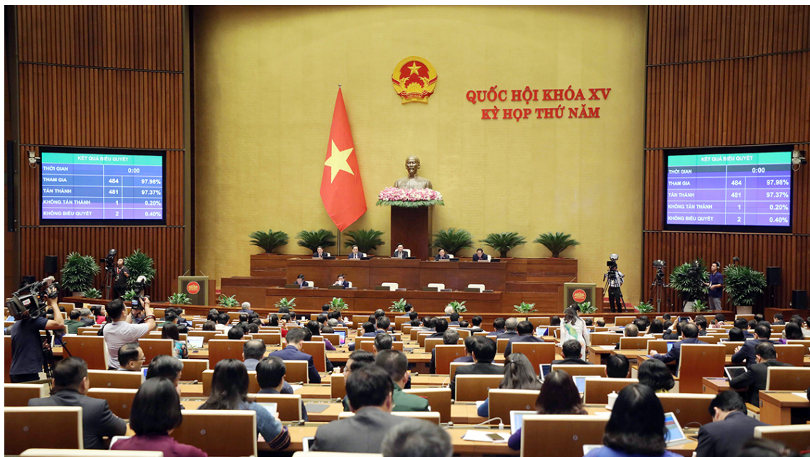
Hình 1. Quang cảnh Quốc hội thông qua Nghị quyết về thí điểm một số cơ chế, chính sách đặc thù phát triển TPHCM

Trong khuôn khổ Kỳ họp thứ 5, Quốc hội khóa XV, chiều ngày 24/06/2023, dưới sự điều hành của Phó Chủ tịch Quốc hội Nguyễn Khắc Định, Quốc hội đã biểu quyết thông qua Nghị quyết về thí điểm một số cơ chế, chính sách đặc thù phát triển TPHCM với 481/484 đại biểu Quốc hội tham gia biểu quyết tán thành, tỷ lệ 97,37% tổng số đại biểu Quốc hội. Nghị quyết có hiệu lực thi hành từ ngày 1/8/2023.